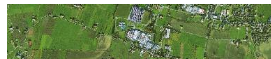
Architettura industriale nell'area di Reggio Emilia, Emilia Romagna 44° 55' N, 10° 43' E Immagine satellitare GeoEye-1 acquisita l'11 dicembre 2010