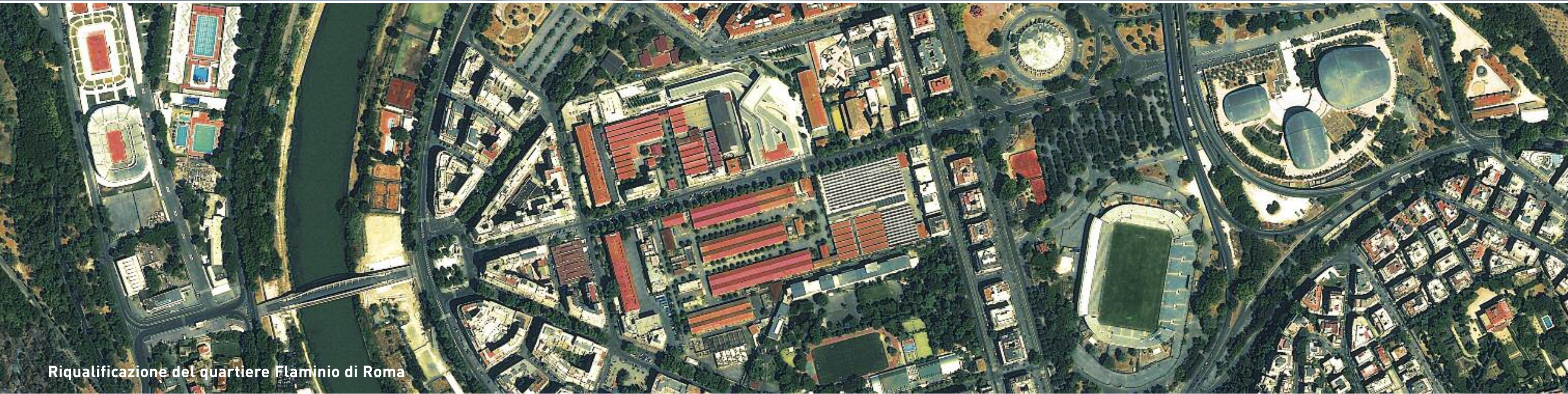
Riqualificazione del quartiere Flaminio di Roma

Il recupero sostenibile delle aree urbane è uno degli strumenti per lo sviluppo della smart city.