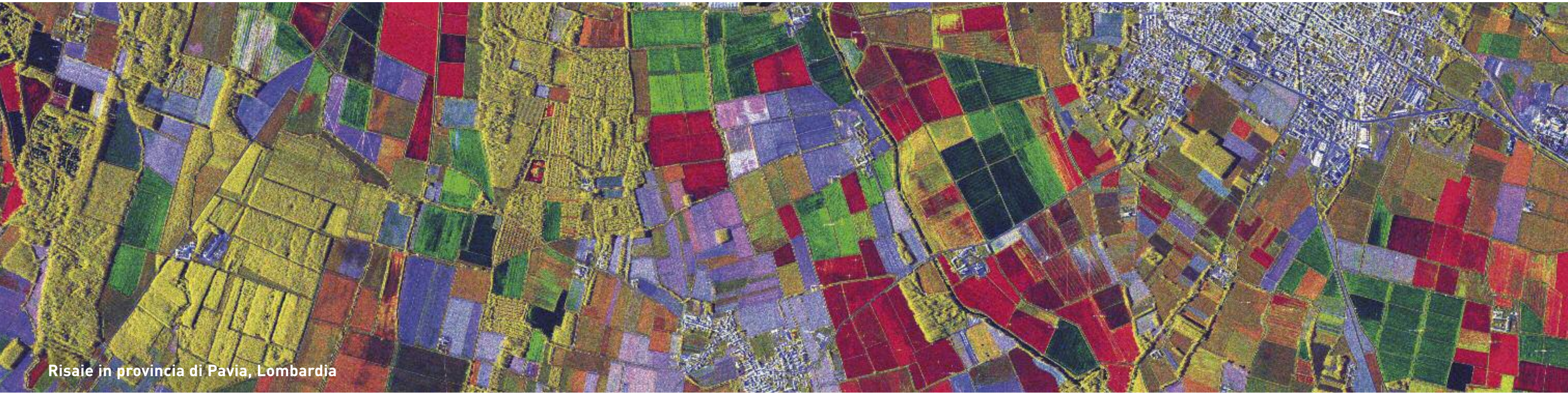
Risaie in provincia di Pavia, Lombardia

Risaie, uliveti e vigneti caratterizzano in un'armonica fusione di linee e colori il paesaggio italiano.