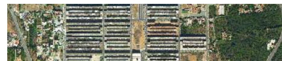
Quartiere ZEN di Palermo, Sicilia 38° 11' N, 13° 19' E Immagine aerea RealVista © e-GEOS, acquisita nel mese di giugno 2007