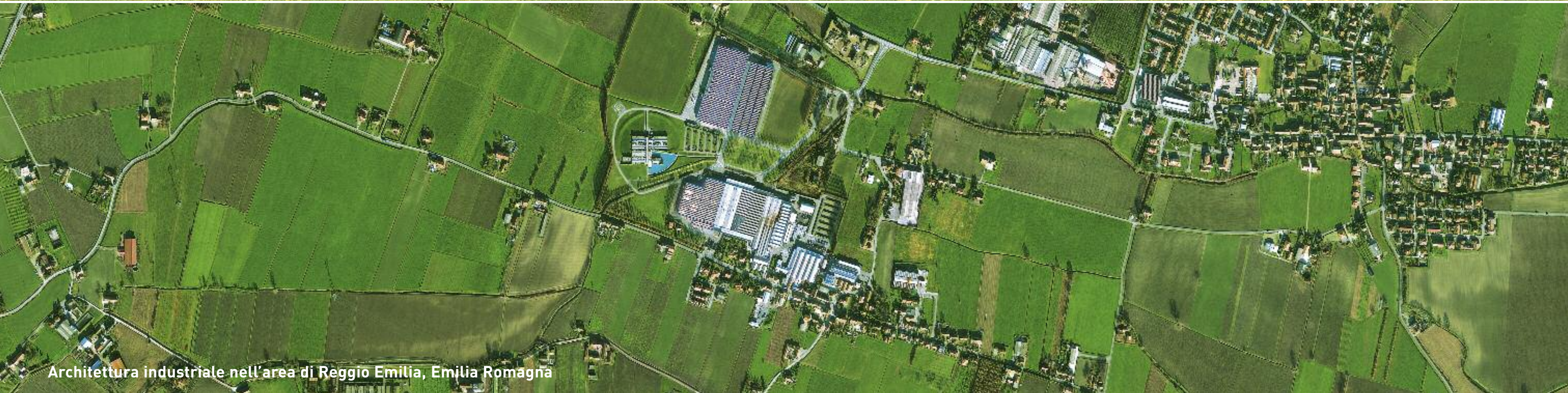
Architettura industriale nell'area di Reggio Emilia, Emilia Romagna

La nuova architettura industriale stabilisce un rapporto sostenibile con l'ambiente e il paesaggio.