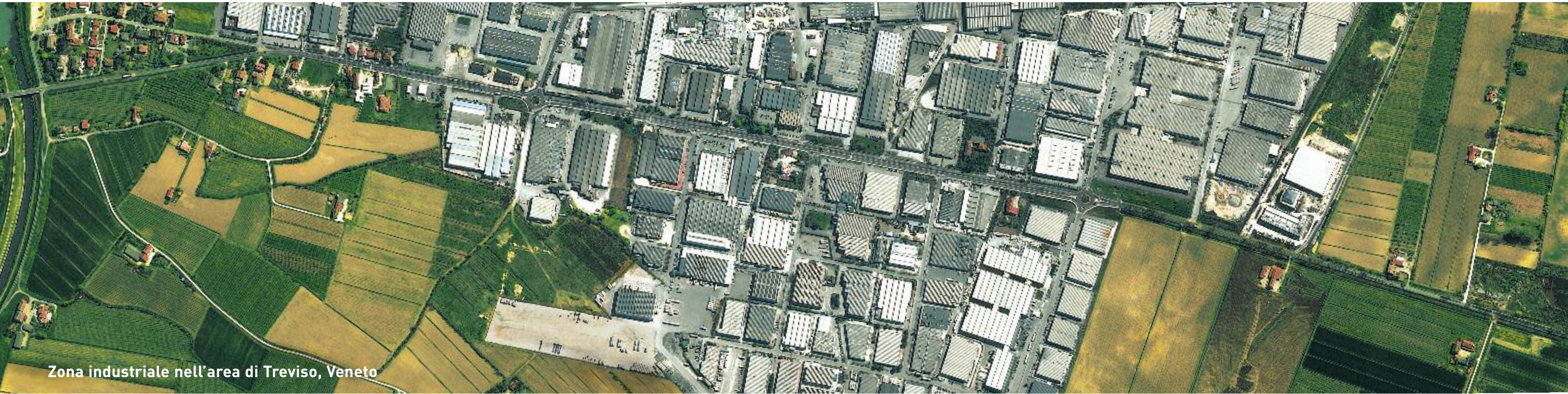
Zona industriale nell'area di Treviso, Veneto

Paesaggio industriale: ferro e cemento incombono sull'equilibrio tra uomo e natura.