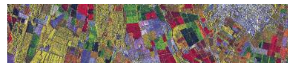
Risaie in provincia di Pavia, Lombardia 45° 11' N, 08° 53' E Combinazione di tre immagini satellitari COSMO-SkyMed © ASI, acquisite il 4 maggio - 20 maggio - 5 giugno 2009