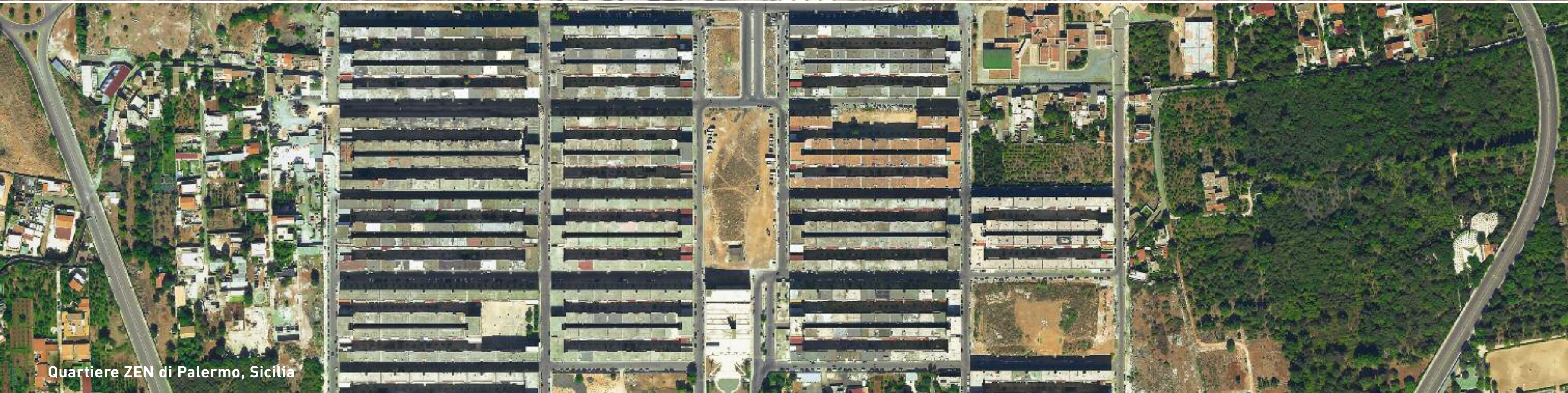
Quartiere ZEN di Palermo, Sicilia

Negli ultimi quaranta anni la superficie urbanizzata del nostro Paese è cresciuta del 500%.