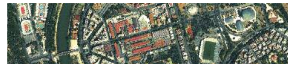
Riquilificazione del quartiere Flaminio di Roma 41° 56' N, 12° 28' E Immagine satellitare GeoEye-1 acquisita l'11 agosto 2012

Il calendario 2012 è stato realizzato con la collaborazione di e-GEOS, la società costituita da Telespazio (80%) e dall'Agenzia Spaziale Italiana (20%) che svolge tutte le attività relative al settore dell'osservazione della Terra.