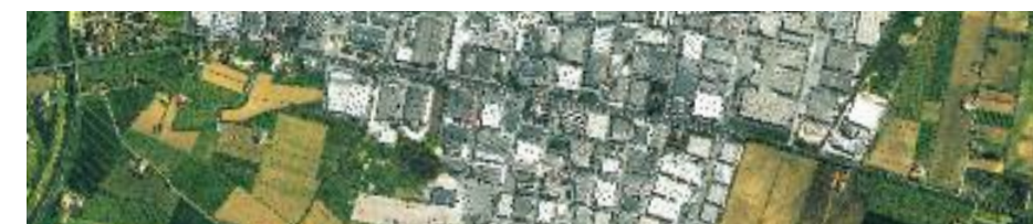
Zona industriale nell'area di Treviso, Veneto 45° 45' N, 12° 37' E Immagine satellitare GeoEye-1 © GeoEye Inc., acquisita l'8 aprile 2010